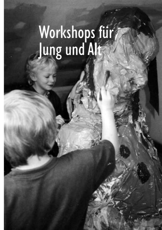
Projekt 2006 „Die Riesen“

(ermäßigt 14,40 EUR) zzgl 3 EUR für Material