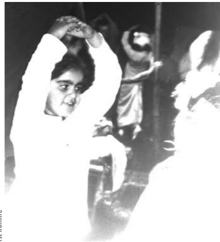
Projekt 2003 „Der Fürst kommt!“

In jedem selbst gestalteten Objekt erkennt man etwas Fremdes und etwas Eigenes, eine wichtige Erfahrung, die Selbstbewusstsein und Persönlichkeitsbildung stärkt.