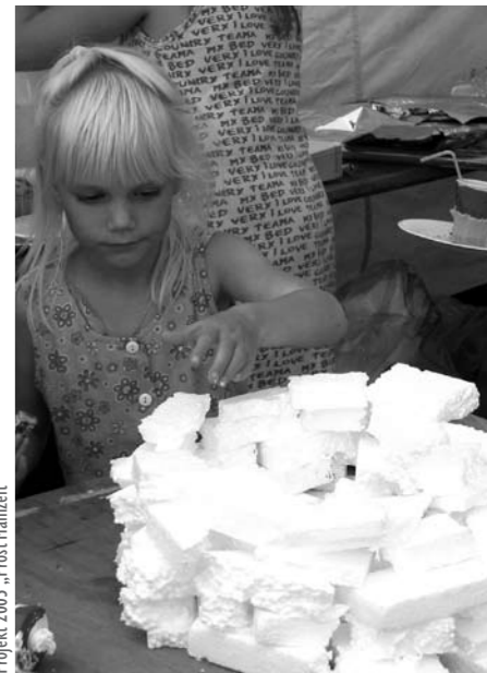
Projekt 2005 „Prost Mahizeit“

Termin: ab 7.5.2012 8 Nachmittage, montags 15-16.30 Uhr Alter: 4-7 Jahre Ort: Kunstschule im Jugendhaus Jever, Leitung: U. de Buhr Teilnahmegebühren: 43 EUR ermäßigt 34,50 EUR (+ 6 EUR für Material)