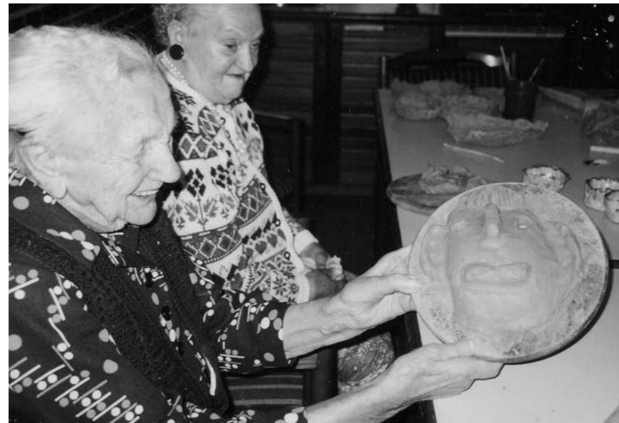
Töpfern im Altenheim 2001

Fotos aus Kursen, Workshops und Projekten werden für die Darstellung unserer KS werblich verwendet. Die Weitergabe von Adressen und Informationen an Dritte ausserhalb der Kunstschule findet nicht statt.