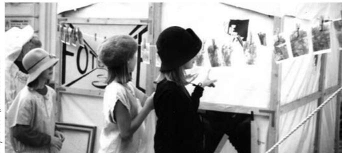
Projekt 1997 „Von Hut bis Schuh“

Anmeldung (bitte an: Kunstschule Kiebitz Jever, Dr.-Fritz-Blume-Weg 2, 26441 Jever)