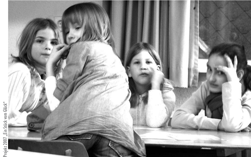
Projekt 2007 „Ein Stück vom Glück“

Teilnahmegebühren: 43 EUR erm. 34,50 (zzgl. 6 EUR f. Mat.)