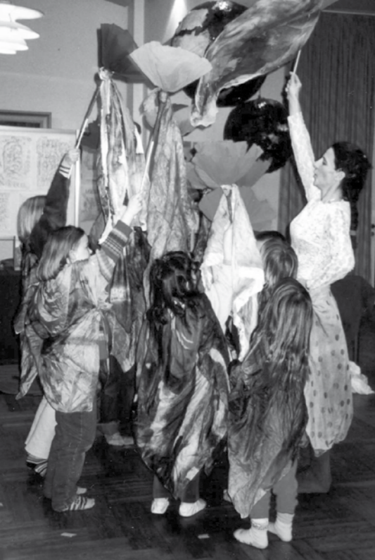
„Blütentanz“ am Tag der offenen Tür 2001