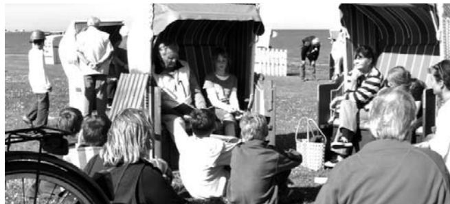
Projekt 2010 „Horumerspiel“