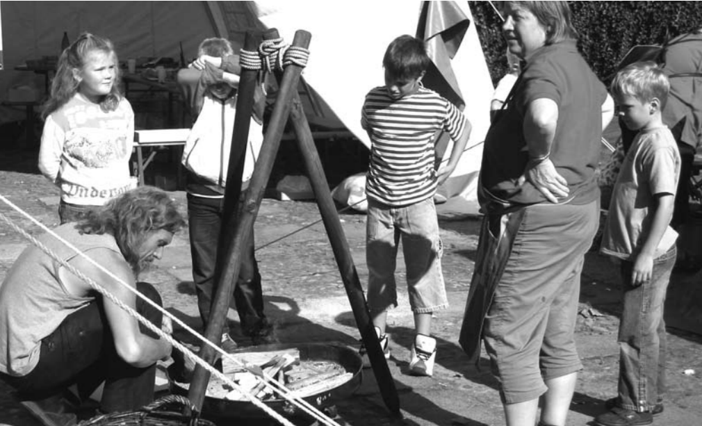
Projekt 2005 „Prost Mahizeit“