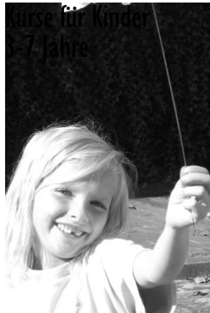
Projekt 2005 „Prost Mahizeit“